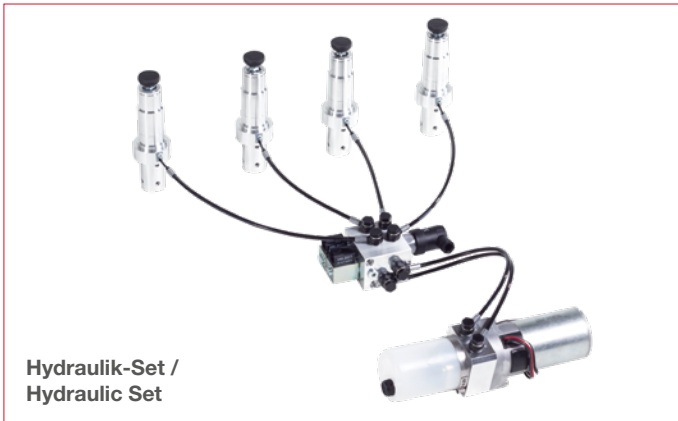
Hydraulik-Set / Hydraulic Set